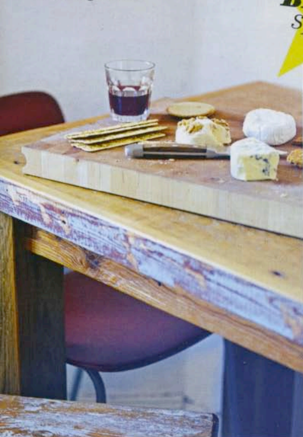
Essen von Holz, das andere mit Füßen treten? Kein Problem, jedes Stück ist sauber abgeschliffen