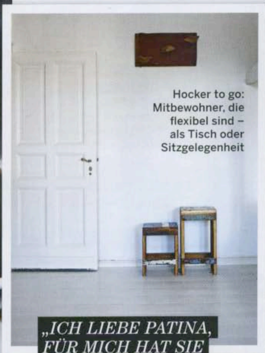
Hocker to go: Mitbewohner, die flexibel sind – als Tisch oder Sitzgelegenheit

„ICH LIEBE PATINA, FÜR MICH HAT SIE NICHTS VERKLÄRTES. JEDE LACKSCHICHT AUF DEN DIELEN STEHT FÜR LEUTE, FÜR VERÄNDERUNG. DAS BEI MEINER ARBEIT NACHZUVOLLZIEHEN, IST SPANNEND“